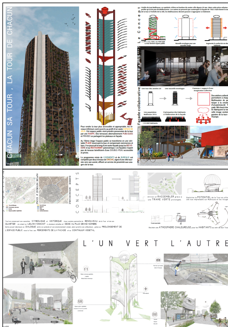
Planches des équipes strasbourgeoises : DRL023 (en haut) et PUC515 (en bas)

La Maison européenne de l'architecture vous invite à visiter l'exposition des 12 projets participants de ce concours. L'exposition sera visible à la Maison de l'urbanisme (Grand Rex – 33a, avenue de Colmar) à Mulhouse jusqu'au 30 novembre 2015 . Pendant tout le mois de janvier elle se trouvera dans le hall de l'office du tourisme de Mulhouse (1, avenue Robert Schuman), qui se trouve juste au pied de la Tour de l'Europe !